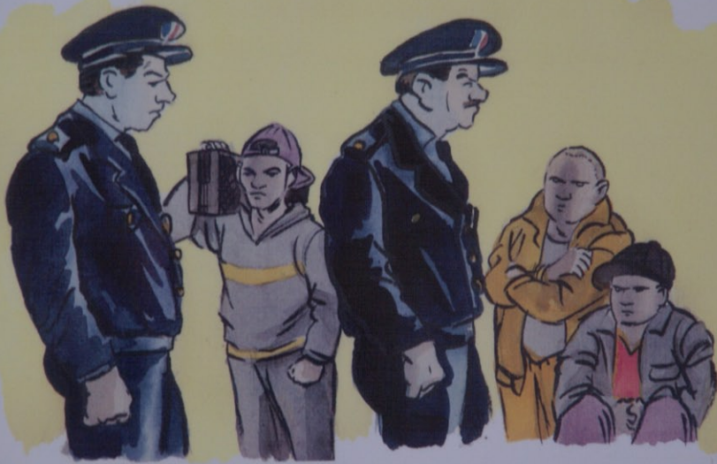
Les mondes parallèles