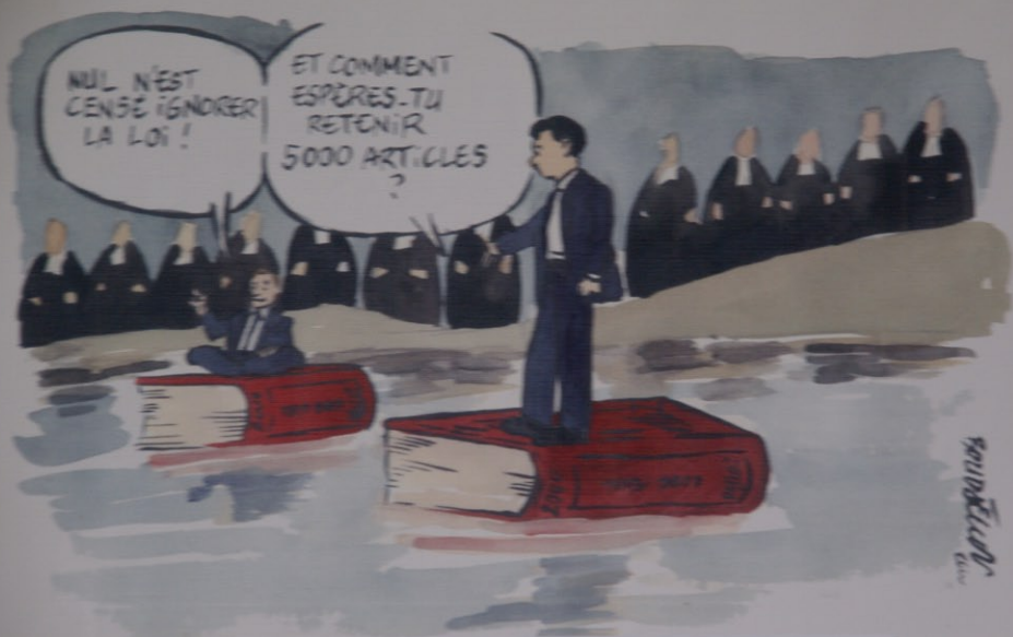
Une mémoire d'éléphant