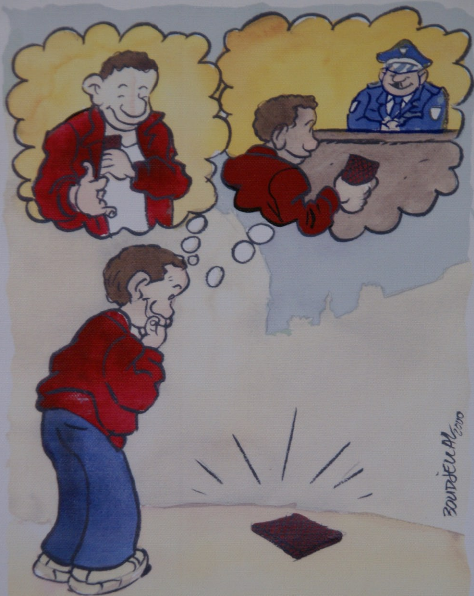
Cas de Conscience